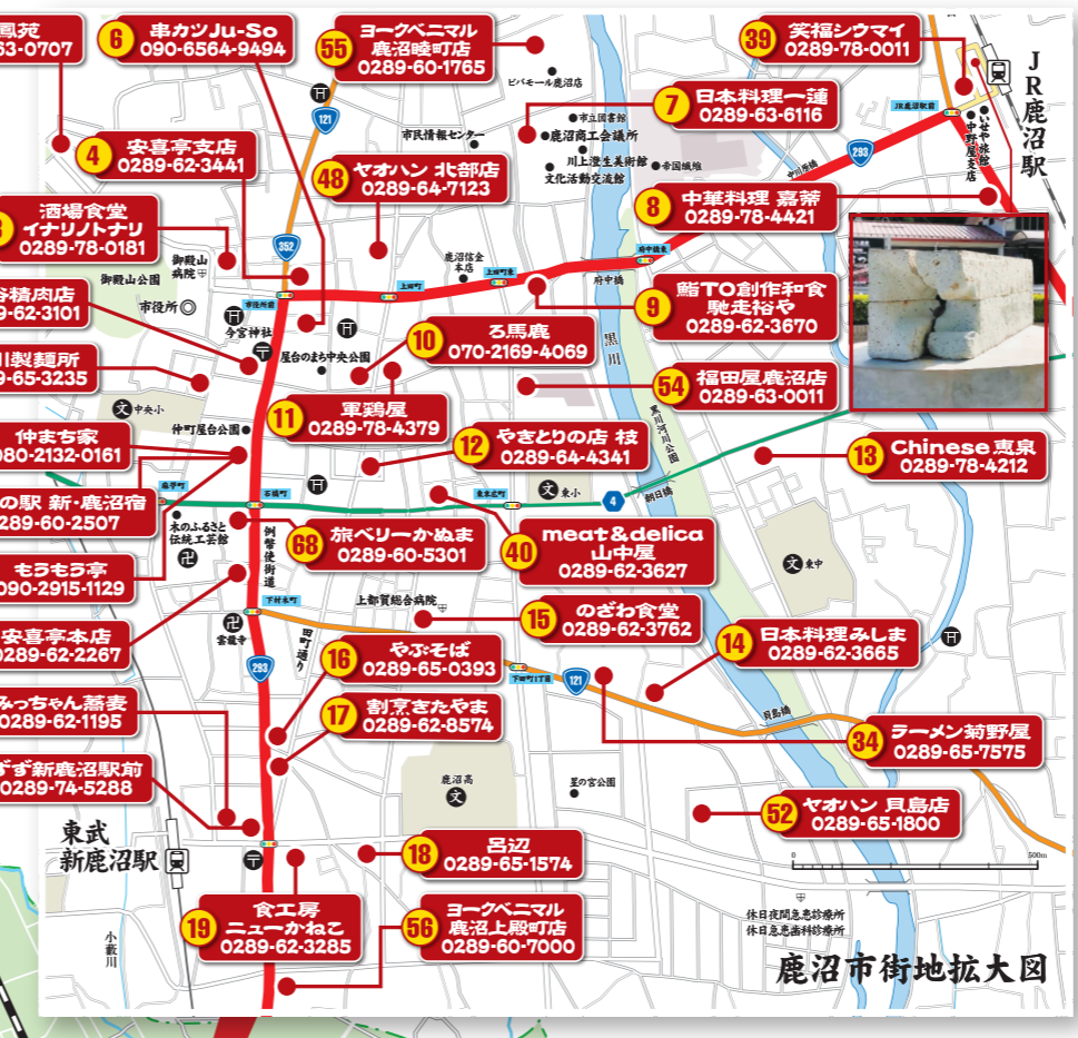
鹿沼市街地拡大図